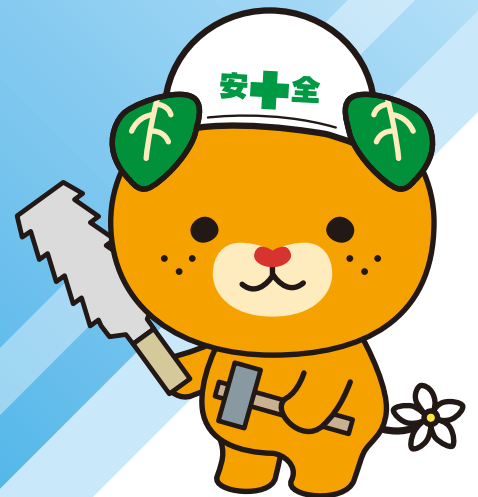
愛媛県イメージアップキャラクター みきやん